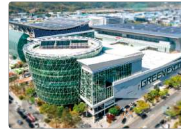
대구광역시 북구 엑스코로 10 http://www.exco.co.kr

2001년 개관 이후 EXCO는 글로벌 이벤트의 중심지로 자리 잡았으며, 매년 권위 있는 학술 회의와 전시회를 개최하고 있습니다. 최근 제2전시관의 개관하여 대규모 전시 및 컨벤션을 위한 최상의 환경이 마련 되어 있으며, 2025년 개최될 FASAVA 2025의 최적지로 많은 참가자에게 쾌적한 환경을 제공할 예정입니다.